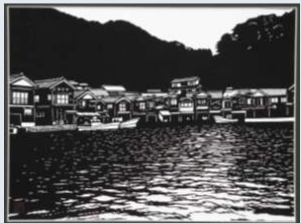
Le village d'Ine et ses Funa-yas, maisons à bateau avec ancrage

- Il faut compter 2 à 3 mois de travail pour cette création, dont les deux tiers du temps ont été alloués au dessin de préparation précédant le découpage.